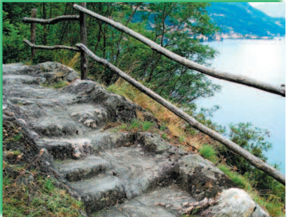
Il sentiero scavato nella roccia

del massiccio promontorio che sovrasta Dervio. Procedendo lungo la strada, si giunge al "Crotto del Cech" da dove prima del sottopasso della ferrovia, parte la bella mulattiera in acciottolato che sale verso le cascine del Chignolo, qui già si ammira il panorama del nuovo porto turistico, i centri velici e della penisola derviese. Attraversata la valle del Chignolo si sale verso i Ronchi un nucleo di cascine posto sulle propaggini del monte Muggio, incontrando lungo la mulattiera: incisioni, coppelle e gradini scavati nella roccia segnati dal secolare passaggio delle slitte. Al bivio con la via ai Ronchi si prende a destra in direzione sud lungo il percorso dove si aprono belle viste panoramiche su Bellano e Dervio, con il lago spesso solcato da barche a vela.