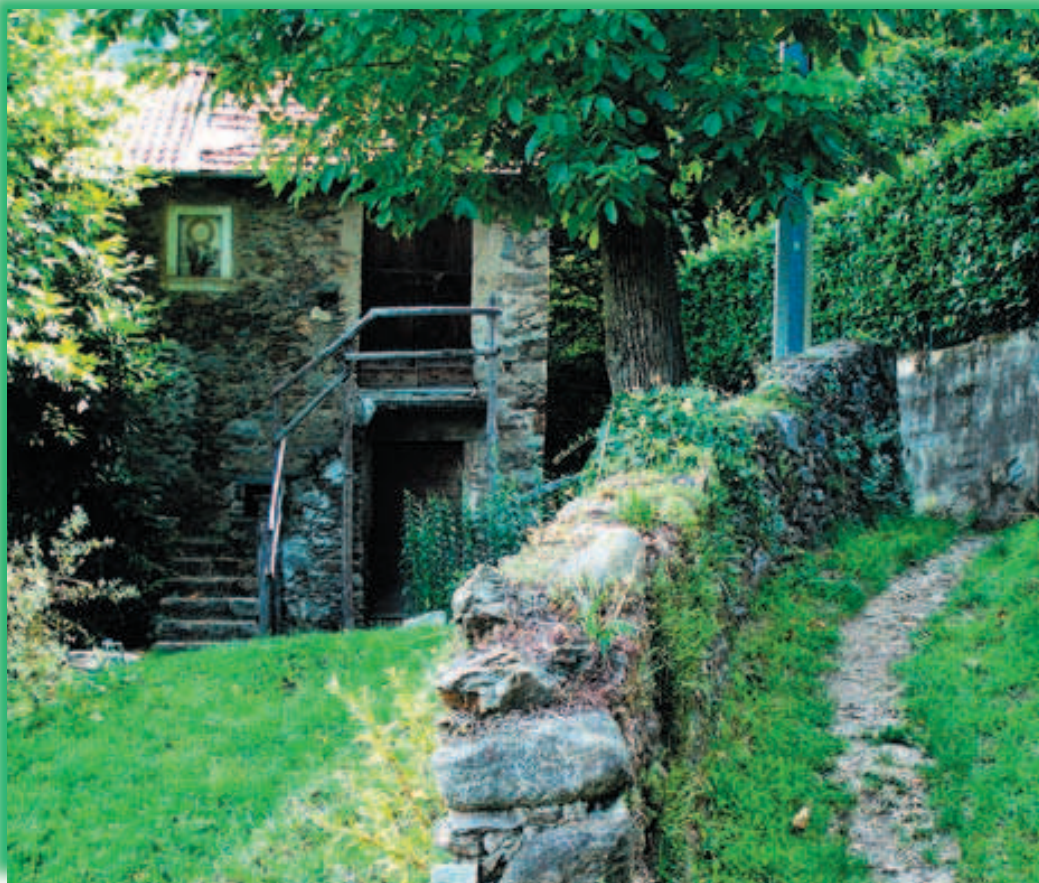
Cascinale a Lezzeno

Attraversata, su un ponte di legno, la “Val Granda” si entra nel territorio di Bellano incontrando poco dopo la località di Verginate con cascine ristrutturate ed una cappelletta di fattura barocca. Procedendo fra i terrazzamenti con tracce delle colture della vite e dell’olivo si supera una valle da cui parte la strada asfaltata che porta alla parte alta della frazione Oro, questa si sviluppa con le sue case rustiche ristrutturate sino alla riva del lago fra le quali svetta il campanile della chiesa di S. Gottardo. Procedendo si imbecca sulla sinistra una gradinata di recente realizzazione che sale verso Pendaglio, al bivio si prende a destra con un sentiero che, superata una fontanella, attraversa i prati in posizione sopraelevata rispetto alla superstrada. Si attraversa l’ombrosa valle dei mulini con i ruderi degli edifici e si procede poi fra prati con stalle e castagneti superando una valle con ponte in pietra. Si raggiungono così le prime cascine e case di Lezzeno ed attraversando la provinciale per Vandrognò si passa vicino ad un vecchio lavatoio ed in mezzo al nucleo storico.