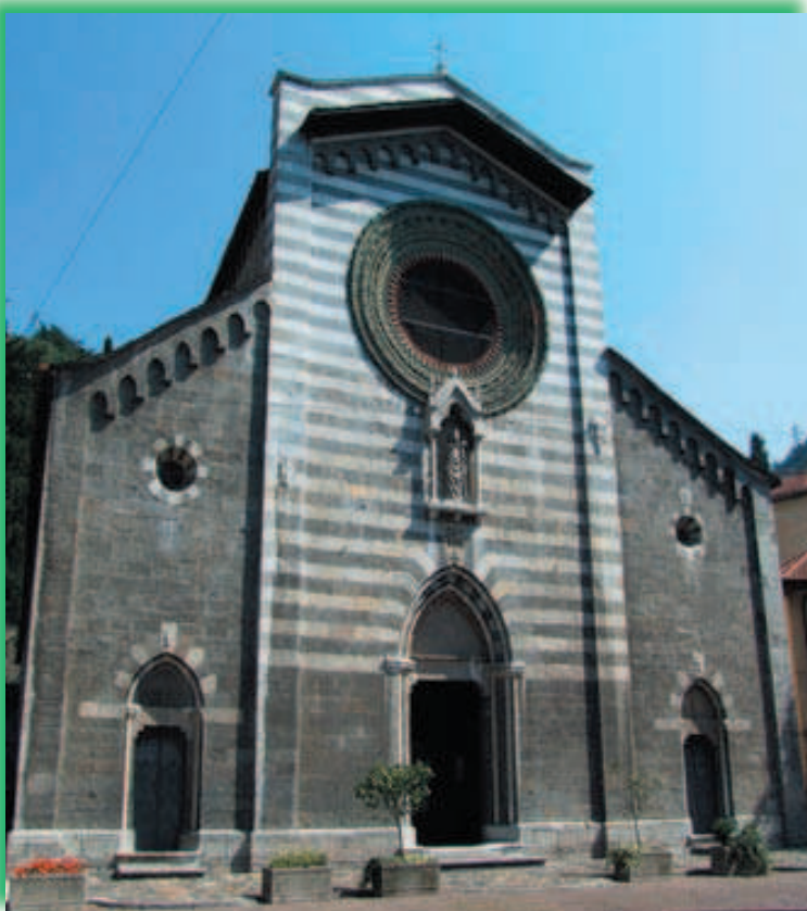
La Chiesa Parrocchiale di Bellano