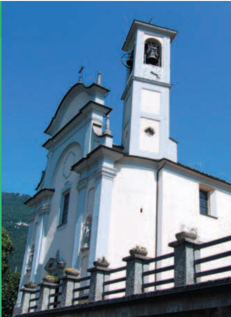
Il Santuario di Lezeno

Prendendo a sinistra si entra nella località di Ombriaco incontrando la chiesa di S. Bernardino, prima di raggiungere la scala che sale alla chiesa si prende a destra una mulattiera in ripida discesa verso Bellano, si costeggia il cimitero e si raggiunge la chiesetta di S. Rocco. Il “Sentiero del viandante” prosegue a sinistra in direzione di Biosio attraversando il ponte sul fiume Pioverna, ma il nostro itinerario si conclude scendendo la scalinata che porta all’Orrido, monumento naturale che merita una visita, con una serie di salti d’acqua e cascate all’interno di forre. Si passa poi di fianco alla parrocchiale dedicata ai santi Nazaro e Celso ed all’edificio di archeologia industriale dell’ex Cotonificio cantoni, infine attraversando il Pioverna sulla provinciale 72 si raggiunge la stazione FS di Bellano da dove con tutti i treni locali o gli autobus per la Valvarrone si può rientrare a Dervio.